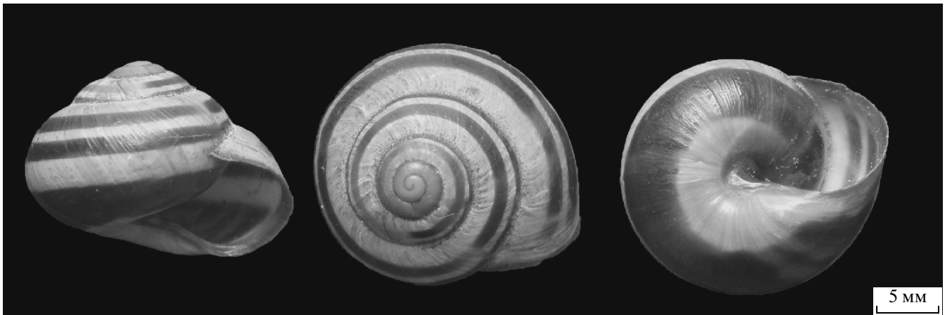
Рис. 2. Cerpaea nemoralis из окрестностей с. Китайгород (пункт 25), коллекция Г.А. Романова.

ет дополнительного подтверждения. Это вид изредка встречается в горной и равнинной частях западной Украины, в последнем случае — достоверно зарегистрирован пока лишь на территории Львовской обл. (Гураль—Сверлова, Гураль, 2012). В то же время за M. incarnatus иногда ошибочно принимают отдельных особей широко распространенного на западе Украины Monachoides vicinus (Rossmässler 1842) с не полностью закрытым пупком. Характерно, что в работах Бельке (Belke, 1853) и Новицкого (Новицкий, 1938) M. vicinus отсутствует, хотя, по нашим данным (таблица), он довольно обычен для Хмельницкой обл.