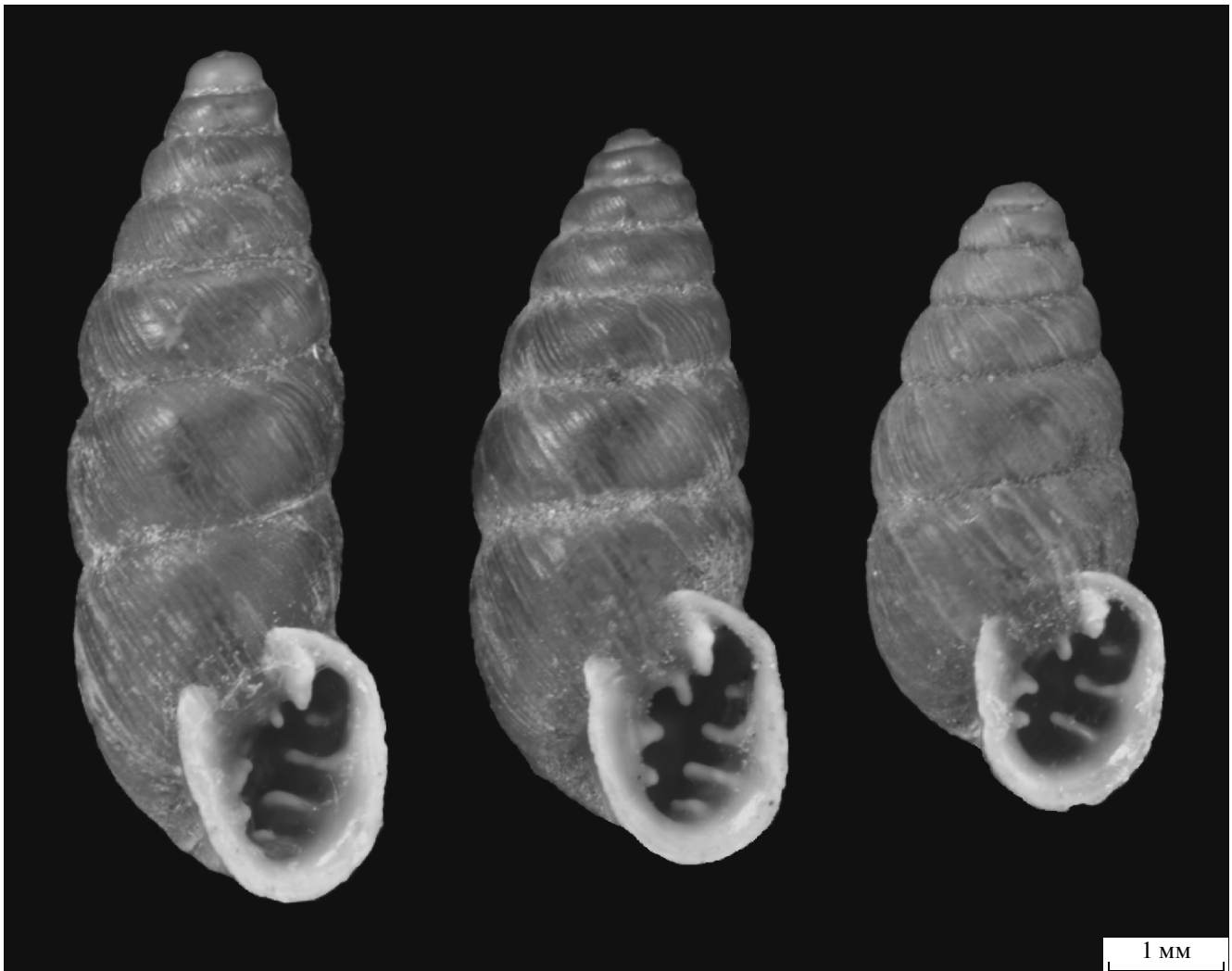
Рис. 4. Chondrina arcadica clienta из окрестностей с. Белая (пункт 16), коллекция Института зоологии НАН Украины.

ная как Helicodiscus singleyanus (Pilsbry 1889) ( Lucilla singleyana ) – каталог Сысоева и Шилейко (Sysoev, Schileyko, 2009). Эта и еще 2 раковины собраны в с. Замахов Новоушицкого р-на Хмельницкой обл. В.А. Присяжнюком в 1969 г. (устное сообщение А.В. Сысоева). По более выраженной скульптуре, непросвечивающим стенкам раковины и особенно по форме устья обсуждаемая раковина на фотографии не вполне соответствует описаниям и изображениям L. singleyana и Lucilla scintilla (Lowe 1852) из различных регионов Европы (Riedel, Wiktor, 1974; Kerney et al., 1983; Horsak et al., 2009). По тем же признакам эта раковина отличается от раковин моллюсков из Закарпатской и Донецкой обл. Украины, определенных нами как L. singleyana (материал в коллекции Института зоологии НАН Украины). Из родственных L. singleyana видов она более похожа на недостроенную раковину американского вселенца Helicodiscus parallelus (Say 1821), встречающегося иногда в теплицах Ев-