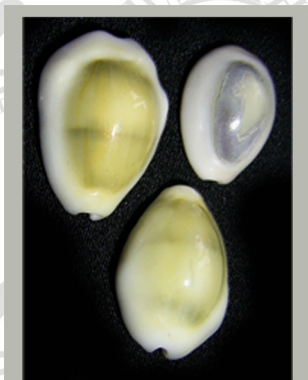
Ципрея - монета