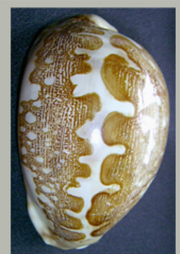
Ципрея - карта

Реже продают раковины арабской ципрей. Темные извилистые линии, действительно, напоминают загадочные арабские надписи. А рисунок на раковинах ципрей-карты похож на топографическую карту. У обоих видов размеры раковин несколько меньше, чем у тигровой ципрей.