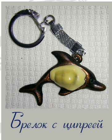
Брелок с ципреей

Каури были не только деньгами. Они прекрасно украшали одежду, волосы, ритуальные маски шаманов. Африканцы носили каури в качестве оберегов от злых сил. Чем больше каури было на человеке, тем надежнее считалась защита. Один из колдунов Западной Африки носил на себе цепь из 20 тысяч раковин, которая весила около 22 килограммов. Каури и сейчас широко используются в сувенирной промышленности. Из них изготавливают бусы, брелки для ключей и другие поделки.