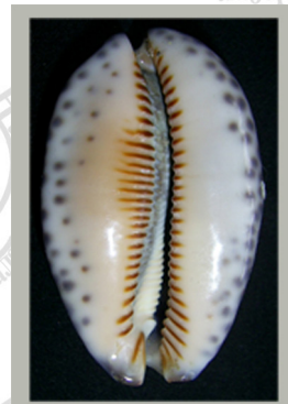
Раковина ципрей снизу

В теплых тропических морях, среди коралловых рифов живут фарфоровые улитки (ципрей). Их раковины, действительно, напоминают удивительные фигурки из лучшего фарфора, которыми сразу хочется украсить полки в шкафу. Недаром ципрей так любят коллекционеры из разных стран мира.