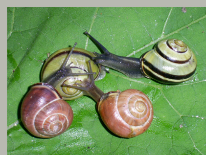
Лесные цепеи из Подмосквья

Продолжим наше знакомство с полосатыми улитками – цепеями. Самыми крупными и яркими из них являются лесные цепеи. Их раковины поражают разнообразием оттенков и рисунков. Тут есть почти чисто белые, лимонные, насыщенно-желтые, розовые (от нежных до насыщенных, почти красных тонов), коричневые; иногда совсем одноцветные или только с одной узенькой полоской, иногда полос значительно больше, и они такие широкие, что почти совсем закрывают общий фон раковины. Но на территории Украины встретить этих ярких «западных гостей» можно лишь очень редко. Хотя при помощи человека им удалось пробраться сейчас и намного дальше на восток. Большие колонии лесных цепей мож-