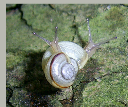
Молодые садовые цепеи

Не пугайтесь: большинство из них не вредит растениям. Даже относительно большим садовым цепеям более по вкусу не зеленые и сочные, а немного привявшие листочки. Но больше всего они любят лишайники и очень мелкие водоросли, образующие зеленый «налет» на стволах и ветвях