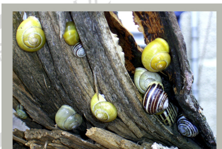
Садовые цепеи во Львове

но увидеть в Подмосквье. На западе Украины в населенных пунктах все чаще встречаются садовые цепеи – немного меньше лесных и часто не такие разноцветные. Особенно много садовых цепей сейчас во Львове и Львовской области. Легче всего найти их там, где есть кустарники или молодые деревья. Садовые цепеи часто имеют ярко-желтые раковины без полос, хорошо заметные даже издали. Лесные и садовые цепеи обитают во многих европейских странах, расположенных западнее Украины.