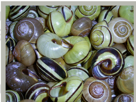
Раковины лесных цепей

Продолжим наше знакомство с полосатыми улитками – цепеями. Самыми крупными и яркими из них являются лесные цепеи. Их раковины поражают разнообразием оттенков и рисунков. Тут есть почти чисто белые, лимонные, насыщенно-желтые, розовые (от нежных до насыщенных, почти красных тонов), коричневые; иногда совсем одноцветные или только с одной узенькой полоской, иногда полос значительно больше, и они такие широкие, что почти совсем закрывают общий фон раковины. Но на территории Украины встретить этих ярких «западных гостей» можно лишь очень редко. Хотя при помощи человека им удалось пробраться сейчас и намного дальше на восток. Большие колонии лесных цепей мож-