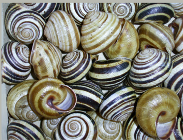
Раковины австрийских цепей

деревьев или кустов. Улитки соскребают этот «налет» при помощи языка, покрытого многочисленными мелкими зубчиками. Недаром этот язык называется теркой. Перед тем, как уничтожить улиток (или других мелких животных) на своем огороде или в саду, присмотритесь, действительно ли именно они причинили вред растениям. Возможно, зеленые листочки погрызли ночью насекомые или слизни, которые днем прячутся в почве.